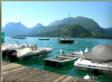
St Jorioz Lac Annecy