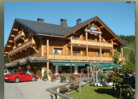
La Clusaz Manigod Les Sapins