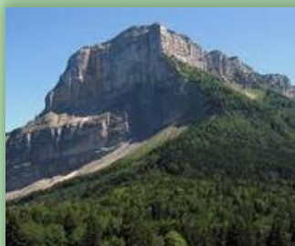
Col du Granier

Challes les eaux, descendre route château, passer 3 rondpoint devant les thermes → centre Challes les Eaux, au feu dans Challes ↑ dir. mairie église, ↑, ↑, Au U 2eme sortie D9 St Baldolph, feu ↑, dir. Autoroute, (la Canopée à gauche), Au U dir. St Baldolph, traverser pont au-dessus autoroute, U St Baldolph, St Baldolph centre, → D201 Barberaz route d'Apremont, dir. Chambéry, Chambéry, feu ↑, U 3eme sortie massif de la Chartreuse, U 2eme sortie massif de la Chartreuse dir. Valence Lyon, U 4eme sortie massif de la Chartreuse, U « épingle » dir. massif de la Chartreuse Col du Granier, → D912 Col Granier, ← D912 Col Granier, ↑ Entremont le Vieux, ↑ St Pierre d'Entremont, → D520c, Traverser Saint-Christophe-sur-Guiers, continuer D520c, Entre-deux-Guiers au stop à droite (pas de direction indiquée) → D520D Les Echelles, → D1006 St Béron, A St Béron D203 La Bridoire, D921, dir le Gué des planches, Lac Aiguebelette, Lépin le Lac, Aiguebelette le Lac : Pot au restaurant « Le Beau Rivage » → D921D Aiguebelette, Au U prendre la 1ère sortie: D921, Novalaise, D921 La Chapelle St Martin, Yenne, D921 Lucey, → D210 Montagnin, St Pierre de Curtille, ← D914 dir Conjux, Avant Conjux → D18, pour aller visiter l'Abbaye de Hautecombe, Conjux, Portout, → petit détour pour aller au petit port de Châtillon, → Chaudieu, → U D991B St Germain la Chambotte, col de la Chambotte, Déjeuner Restaurant au « Belvédère » La Chambotte