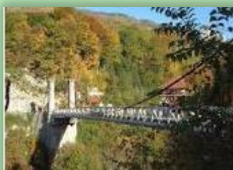
Pont de l'Abîme

↑ D911 autres directions , → D201E St Jean de la porte, La Baraterie, → D11 La Thuille, La Rongère, D11 Le Boyat, ↑ D11 Curienne, La Bâtie, Leysse, → D9, → D912 St Jean d'Arvey, D912 Les Déserts, ← D913 La Féclaz, Trévignin, ↑ D211 Mouxy, Méry, Fournet Montagny , après Montagny ← route de St Saturnin, D8, ← D9 St Alban Leysse, ↑ D912, → D11, ← D1006 La Ravoire, Challes les Eaux.