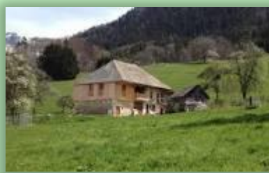
La motte en Bauges