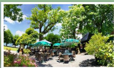
pot Beau Rivage Aiguebelette