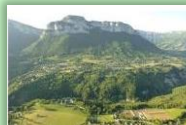
St Jean d'Arvey